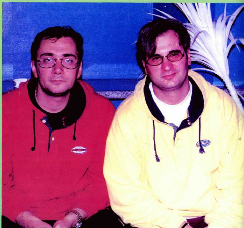
Константин Меладзе и Валерий Меладзе